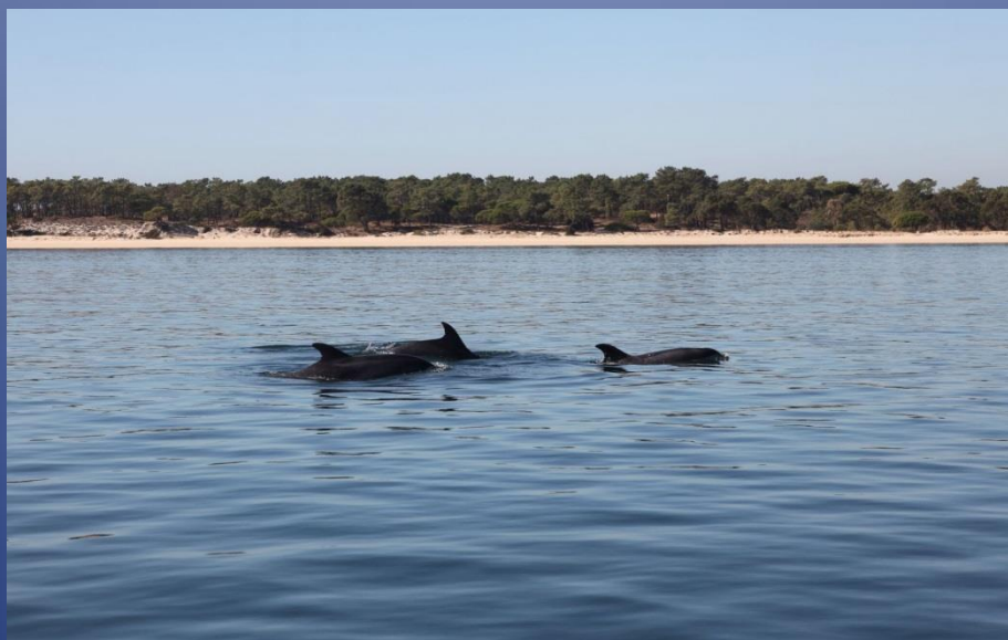
Observação de golfinhos