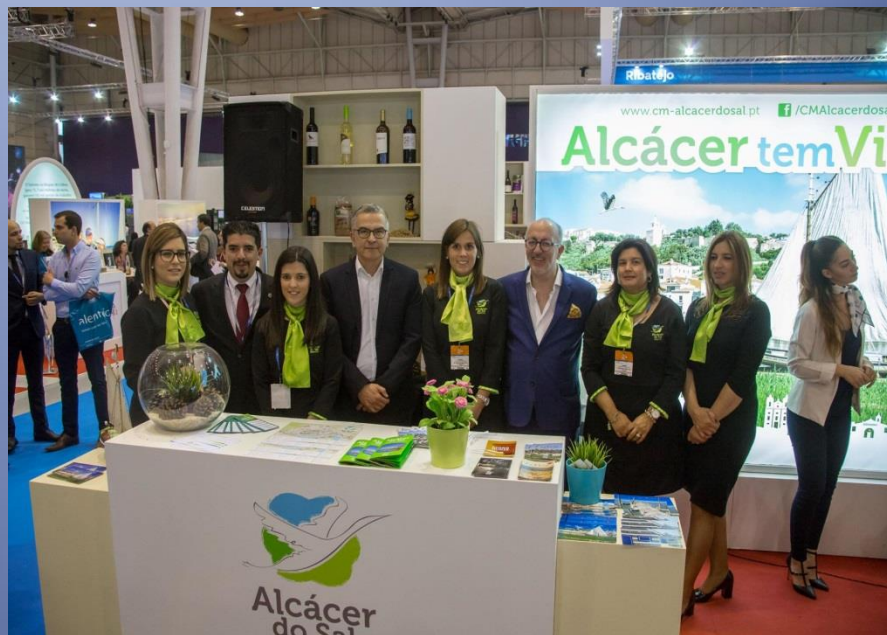
Participação da BTL