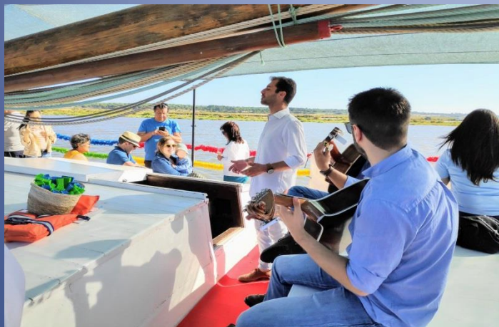
Há Fado no Sado