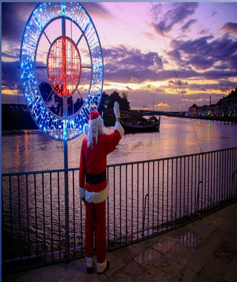
Passeios de natal no galeão

O aumento da procura acompanhou igualmente a promoção em feiras, em órgãos de comunicação social e a criação de novos produtos turísticos, como o passeio de Natal no galeão para desfrutar da iluminação decorativa vista do rio para a cidade, construída num anfiteatro natural.