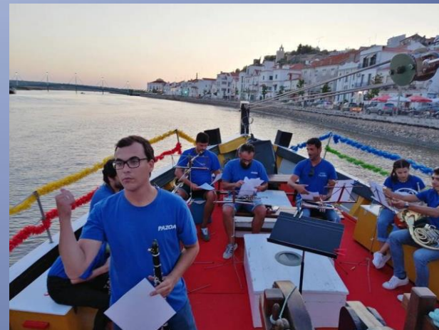
Há Marchas no Sado