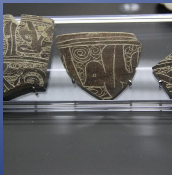
Achados arqueológicos do Museu Pedro Nunes